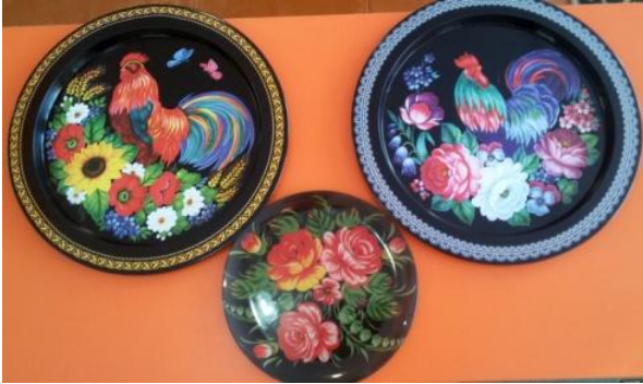
Подносы (жостовская роспись)