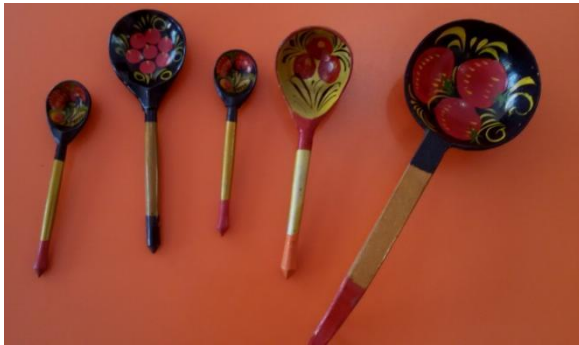
Посуда (хохлольская роспись)